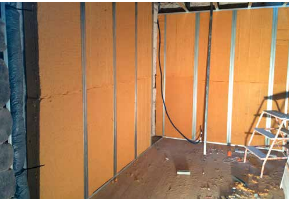
Isolation par l'intérieur par 145 mm de laine de bois, une isolation respectueuse de la perspiration des murs en pierre. Pose de plaques de Fermacell en finition ou murs en pierres apparentes rejointoyées. Au sol, un parquet chêne massif. Les menuiseries sont neuves.