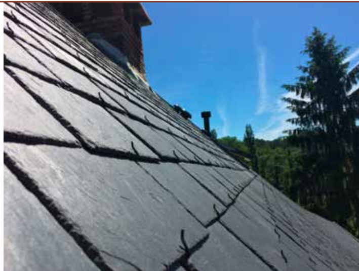
La couverture en ardoise a également été totalement refaite.

“ L’avantage pour le client, c’est de n’avoir qu’un seul interlocuteur, des prix et délais garantis et une seule facture ”