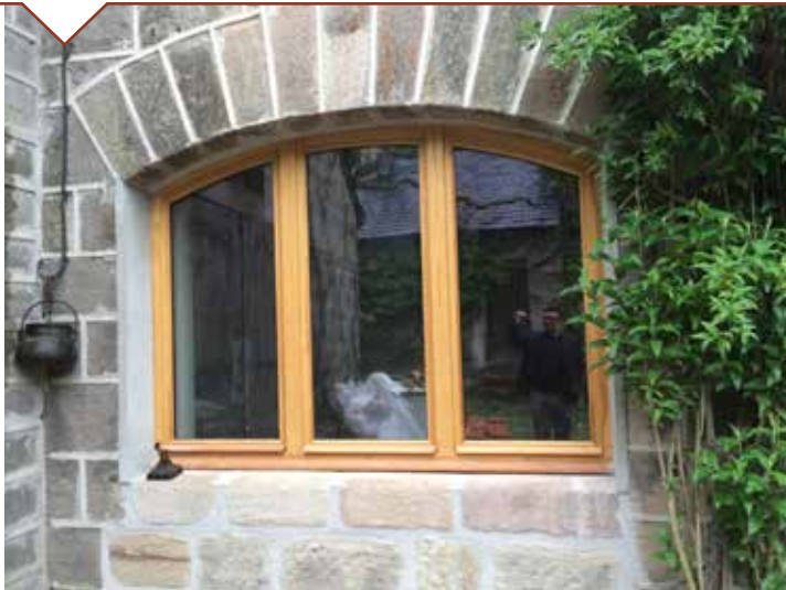
Les menuiseries fabriquées localement sur mesure portent du double vitrage performant.